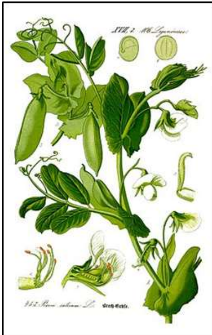
Pisum mauriscus Pois mauresque

Portes ouvertes aux serres municipales organisées par la municipalité sur le thème « les légumineuses » avec la présence régulière de notre association et des associations locales et partenaires liées à la nature. Nous aurons le plaisir de vous accueillir à notre stand pour la 25 ème édition. Nous vous présenterons nos recherches sur les jardins du moyen âge.