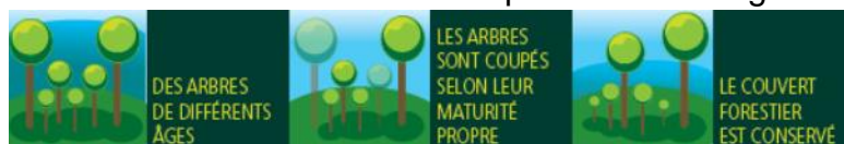
Illustration d'une coupe en futaie irrégulière

Cette coupe est programmée sur une surface de 13.26 hectares.